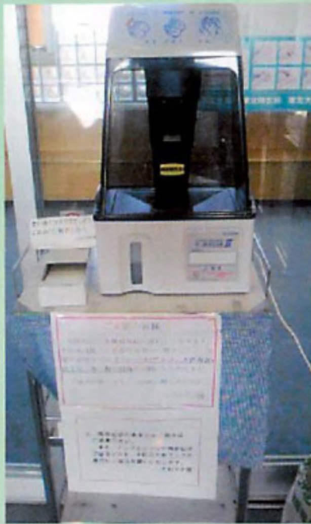
手指消毒とマスク着用の呼び掛け

今年も残すところ後わずかとなって来ましたが、今年は何と云っても、新型インフルエンザのことです。自分や家族が感染してしまいい、大変な思いをした方々もかなりいらっしゃるのではないのでしょうか？ 平成十九年当初の当園の広報誌で表紙挨拶を担当いたしました。その際はノロウイルスの大流行をとり上げました。今回のテーマはインフルエンザという事で、因縁めいたものを感じますが述べてみたいと思います。